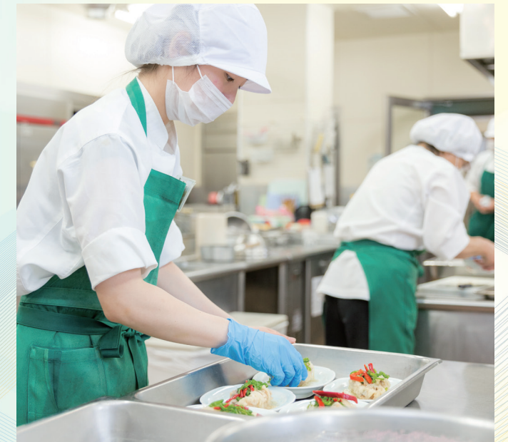
当院厨房にて患者さんの栄養状態改善に向けた食事を準備しています

20年以上前、当時勤務していた急性期病院の管理栄養士さんを病棟で見かけるのは糖尿病の栄養指導のときだけでしたが、その後NST(栄養サポートチーム)が導入され、そのメンバーとして一緒に病棟回診をするようになり、仲良くなりましたが、彼らがチェックできるのは、対象となったごく一部のみで、病棟全体の実際の摂食状況や活動状況を確認することはほとんどありませんでした。彼らの食事や栄養に関する知識は料理も何もできない私からみると驚異的で「神業」と感じるほどのものでしたが、その能力を十分に引き出し、患者さんのために活かすことができずしては。