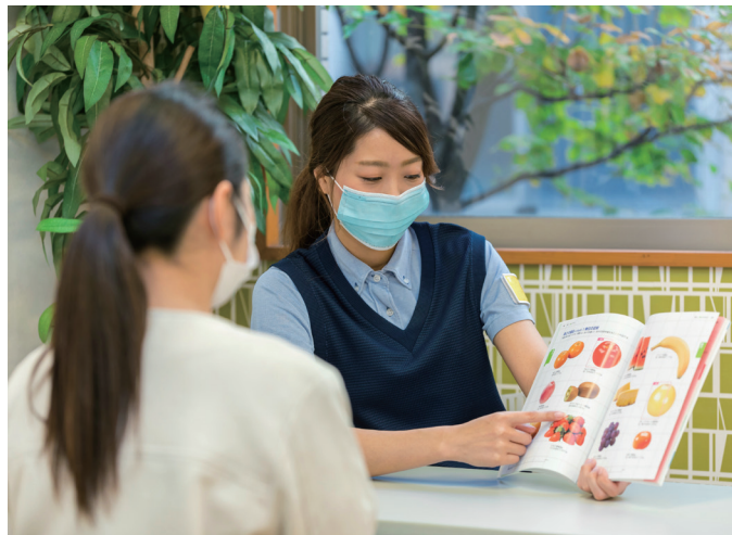
管理栄養士による栄養指導の様子