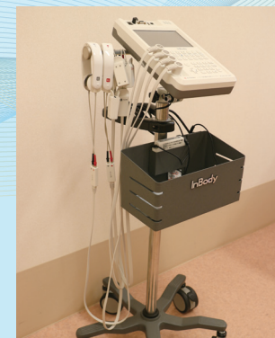
InBody S10(高精度体成分分析装置)

1日3時間の訓練時間、しっかりと実施していただくためにはまず十分な栄養補給が重要です。疾患や機能障害、活動能力低下といったものに対する戦い(いっさ)に必要なエネルギーやタンパク質が提供されなければ、ダイエット病棟、激ヤセ養成病棟になりかねません。