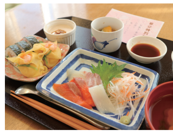
和食の専門調理師による旬の食材を使用したスペシャルメニュー

季節に合わせた食材を使用し、七夕やクリスマス、おせちといった行事食や、山陰で獲れた鮮魚の刺身などの提供も行っています。年2回は調理師が考案した握り寿司やうな丼などの特別メニューも実施しており、患者さんからご好評を多くいただいております。しっかり食べてしっかりリハビリが行えるようなお食事の提供を目指しています。